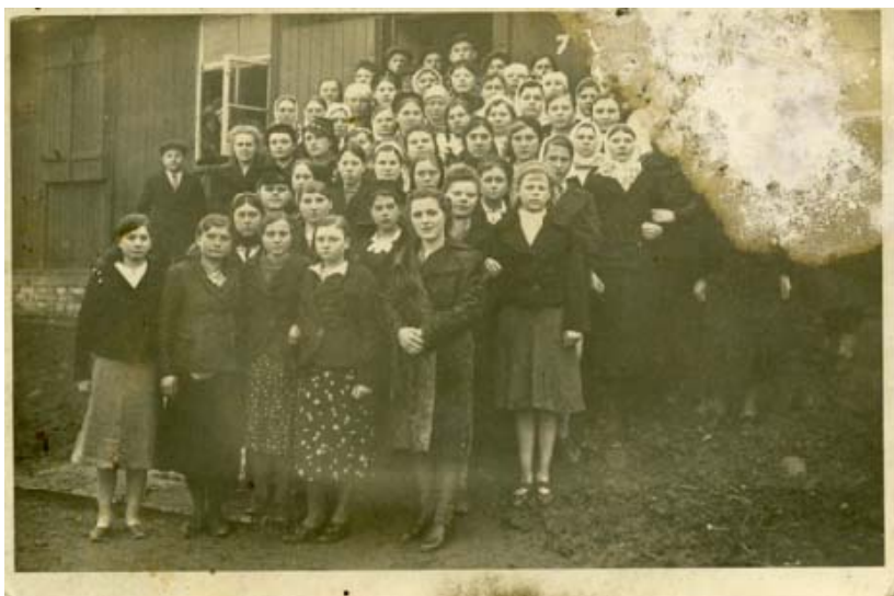
Остарбайтеры в Диффердингене. Из семейного архива Н.Ф. Бичехвоста

нию некоторых историков, «советское государство жестоко расправилось с частью репатриантов, не всегда соразмеряя их вину и степень наказания», многие были осуждены на спецпоселение. К моменту возвращения на Родину все еще действовал «приказ о военнопленных» – приказ за № 270 от 16 августа 1941 г., запрещающий отступление и сдачу в плен под страхом трибунала. Кроме того, действовало «Положение о воинских преступлениях» (1924 г., 1927 г.) и Уголовный кодекс 1926 г., содержавшие специальные статьи об ответственности за сдачу в плен.