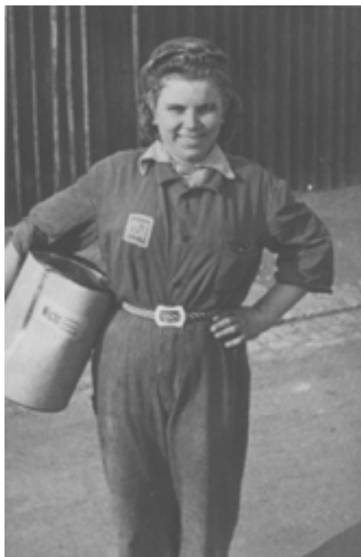
Военный музей г. Дикирх. «Остовка», как называли друг друга девушки, с нагрудным знаком «ОСТ»

В новых лагерных бараках, в комнатах, стояли кровати (по 9 шт.), шкафы и тумбочки, стол и стул для каждого проживающего. Кроме того, была еще комната для общего пребывания, туалет, медицинский кабинет и карцер. Рабочим полагались два одеяла, миска, чашка, вилка, ложка и нож 2 .