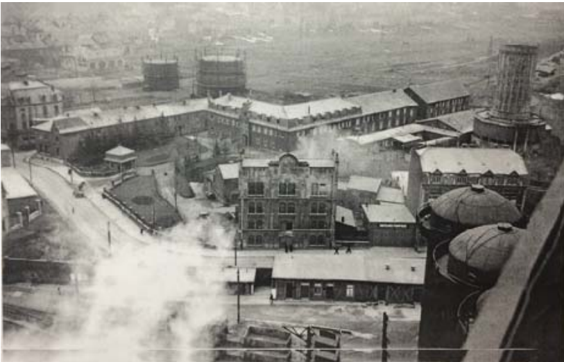
Вид лагеря в Диффердингене с крыши сталелитейного завода «Штальверке»

Всего в источниках упоминается восемь гражданских лагерей, куда прибывали рабочие тремя большими партиями в октябре 1942 г., в июле 1943 г. и в сентябре 1943 г. 1