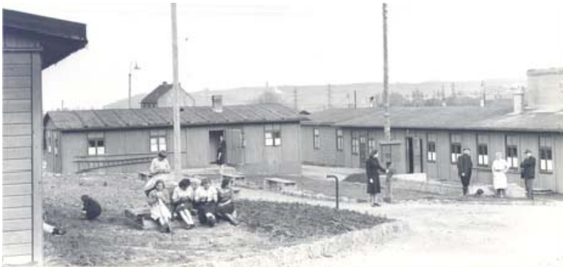
Лагерь остарбайтеров в Эше.

Для обустройства остарбайтеров в лагерях руководствовались соображением, что остарбайтер неприхотлив. Располагали рабочих в силу многих причин на юге страны, непосредственно вблизи заводов, и поначалу размещение осуществлялось в пустующих зданиях, однако вскоре из Франкфурта-на-Майне были доставлены бараки для остарбайтеров, состоящие из готовых элементов, приспособленных для легкой сборки на месте. Для первой партии в составе 229 человек, предназначенной для работ в АРБЕДе, в Бельвале и Роте Эрде, не оказалось достаточного количества постельного белья, а также пригодной для носки одежды и обуви.