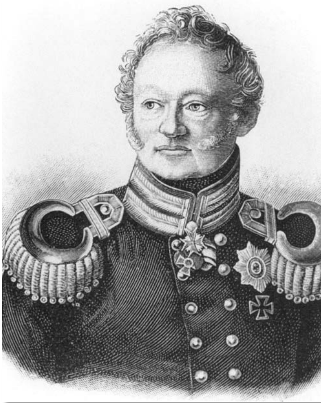
Friedrich Carl Ferdinand Freiherr v. Müffling (1775-1851)