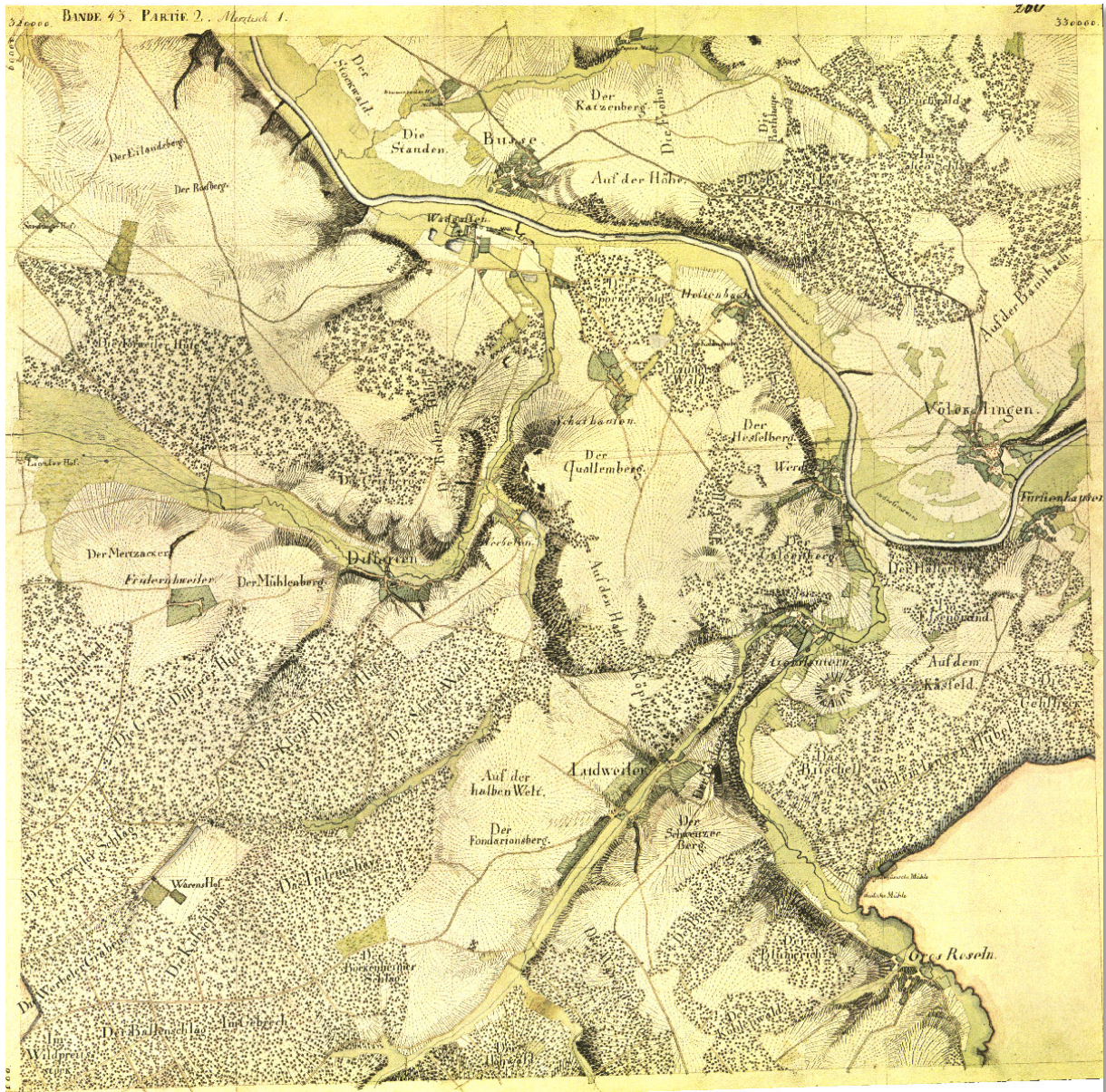
Kartenaufnahme der Rheinlande durch Oberst Tranchot und Generalmajor Freiherr v. Müffling 1803-1820, unter v. Müfflings Regie aufgenommenes Blatt 260 Völklingen

Der Befreiungskrieg brachte ein Ende der topographischen Aufnahmearbeiten durch die französischen Offiziere Tranchots. Nach der Besetzung der Rheinprovinzen durch Preußen und dem Sturz Napoleons 1814 wurde Freiherr Karl v. Müffling (1775-1851), der vorher am Triangulationsnetz der LeCoq'schen Karte für Westfalen gearbeitet hatte, mit der Fortsetzung der Vermessungsarbeiten betraut.