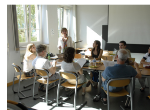
Réunion de travail entre enseignants et chercheurs dans le cadre d'iTEO.